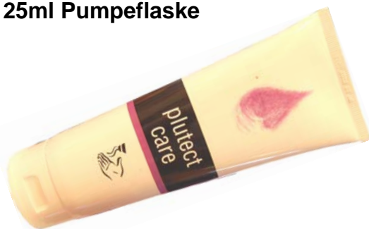
6451 Håndkrem Plutect Care Håndkrem til før, under og etter arbeidet