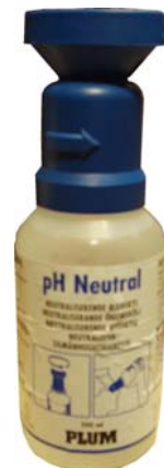
800249 Øyenskyll 200ml Steril fosfatløsning 4,9%