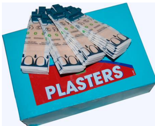
6301 Plaster Stoff 150 stk