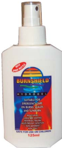
6367 Brannskadegelè Virker også for andre skader, for eksempel vepsestikk. 125ml Pumpeflaske